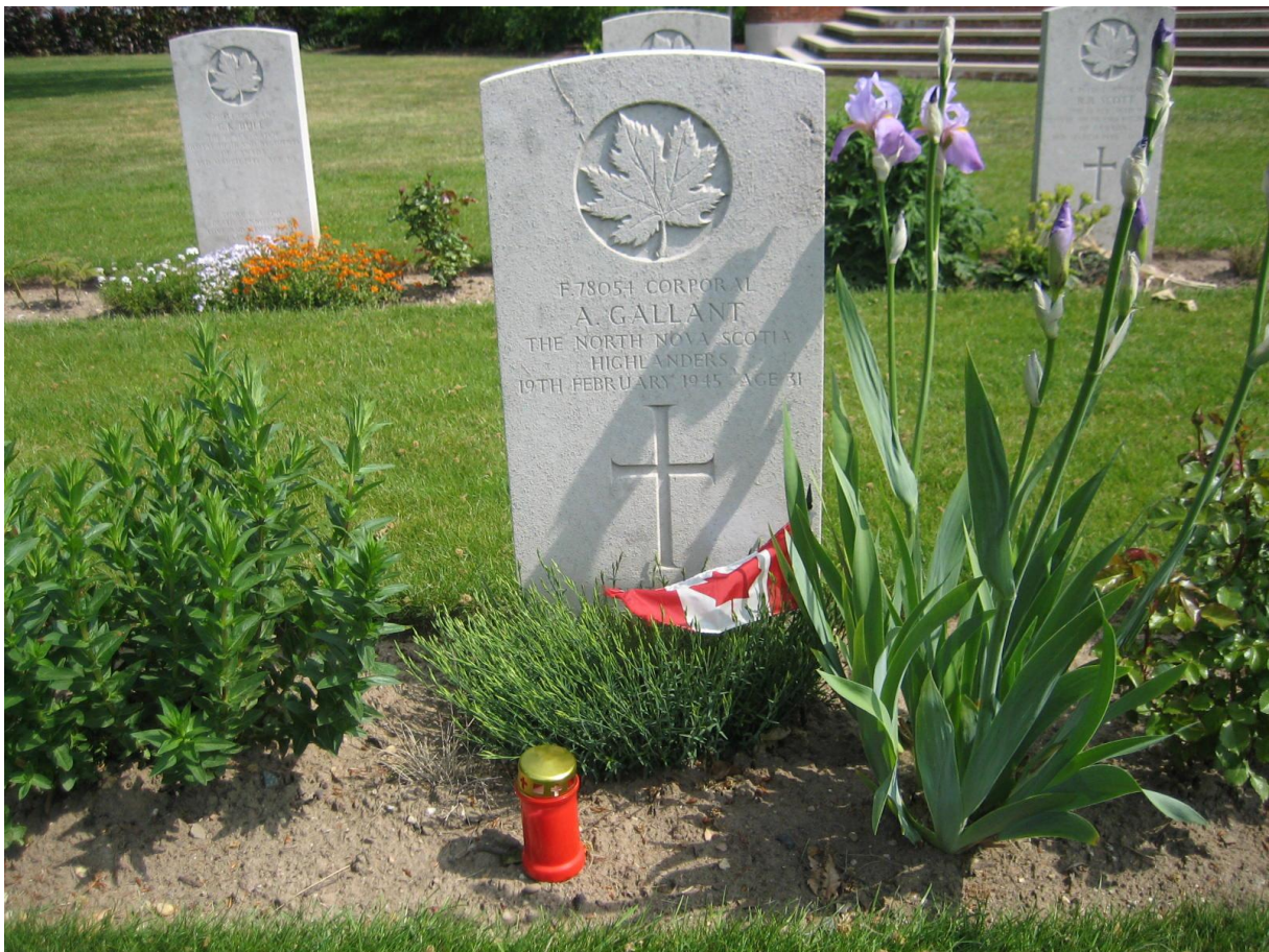
6 mei 2007 - foto Alice van Bekkum.